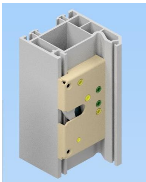
Рисунок 2. Крепление защёлки к профилю рамы.